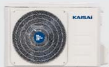
Kültéri egység KRX